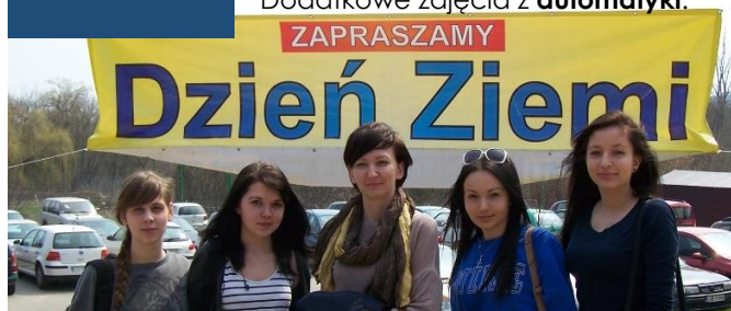
Zajęcia w UMCS w Lublinie z okazji Dnia Ziemi

Przedmioty w rozszerzeniu: matematyka, geografia oraz do wyboru: j. angielski, j. rosyjski, j. niemiecki, informatyka, historia, wiedza o społeczeństwie. Dodatkowe zajęcia z automatyki .