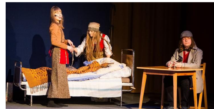
Spektakl Grupy Teatralnej „WARTO” pt. „Opowieść wigilijna”, prezentowany na scenie HDK