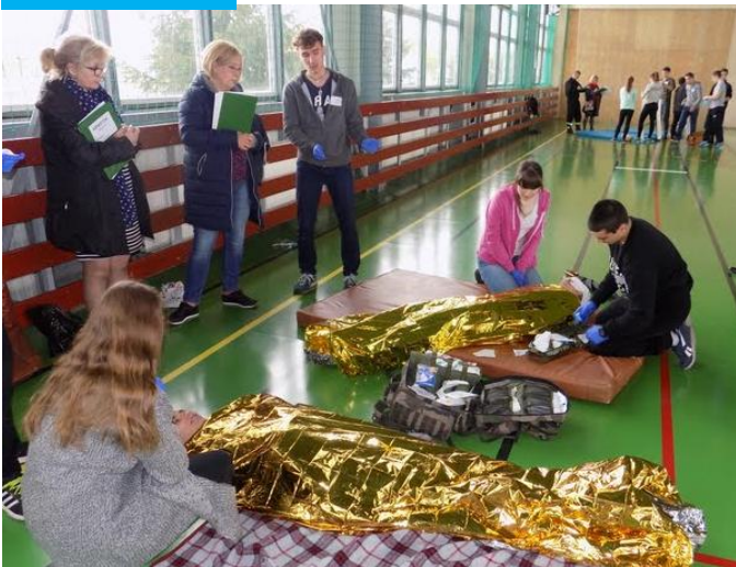
Nasi uczniowie na Rejonowych Mistrzostwach Udzielania Pierwszej Pomocy PCK

Przedmioty w rozszerzeniu: biologia, chemia oraz do wyboru: j. angielski, j. rosyjski, j. niemiecki, wiedza o społeczeństwie, informatyka, geografia, historia. Przedmiot uzupełniający: elementy ratownictwa medycznego .