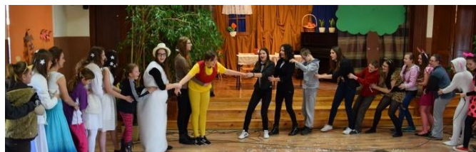
Coroczne spotkanie w auli szkoły z dziećmi z PZPSW z okazji Dnia Pluszowego Misa

Przedmioty w rozszerzeniu: j. polski, biologia oraz do wyboru: j. angielski, j. rosyjski, j. niemiecki, wiedza o społeczeństwie, informatyka, geografia, historia. Przedmiot uzupełniający: psychologia .