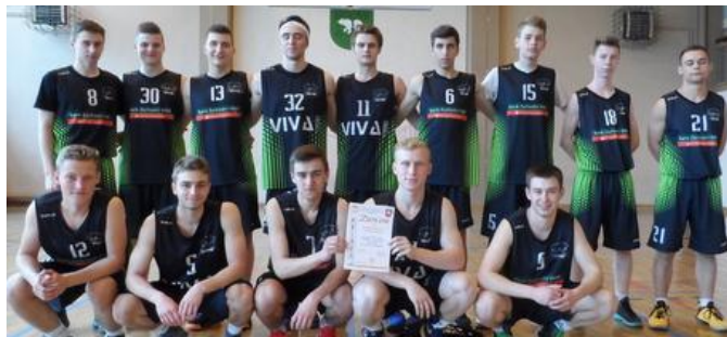
Zdobywcy I miejsca w Wojewódzkiej Licealiadzie w Piłce Koszykowej Chłopców