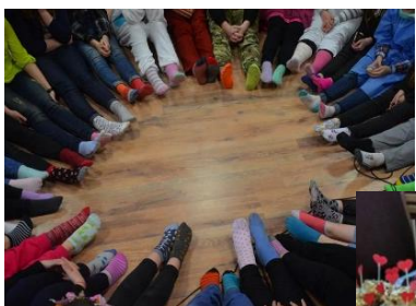
Kawiarenka walentynkowa w auli

Dzień Kolorowej Skarpety – Światowy Dzień Osób z Zespołem Downa