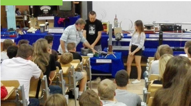
Pokazy fizyczne na UMCS w Lublinie

Przedmioty w rozszerzeniu: matematyka, fizyka oraz do wyboru: j. angielski, j. rosyjski, j. niemiecki, informatyka, historia, wiedza o społeczeństwie, geografia. Dodatkowe zajęcia z automatyki .